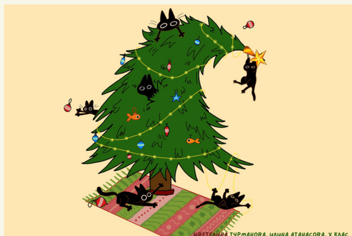
ИВЕТТА ТУРМАНОВА, ИЛИАНА АТАНАСОВА, X КЛАС